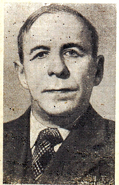
АСЕЕВ НИКОЛАЙ НИКОЛАЕВИЧ — известный советский поэт.

Сегодня литературная общественность нашей страны отмечает 75-летие со дня рождения выдающегося советского поэта, одного из зачинателей советской поэзии — Николая Николаевича Асеева. Имя поэта известно не только в нашей стране, но и далеко за ее пределами. Нам, льговчанам, Николай Асеев близок и дорог еще и потому, что он родился и вырос в нашем городе и воспел могучими стихами наш край — в сборнике стихов «Курские края» и в «Богатырской поэме».