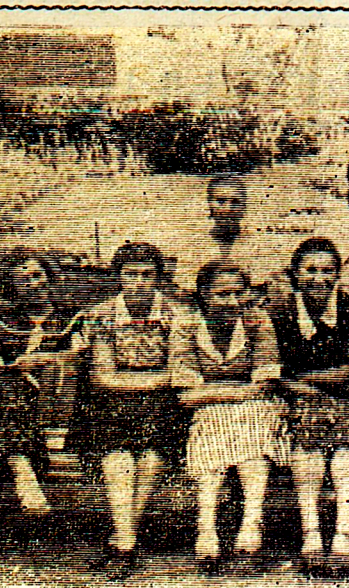
Льговские пионеры в гостях у Н. Н. Асеева.

Когда мы приехали в Москву, то написали письмо Н. Н. Асееву. На следующий день он позвонил нам на туристическую